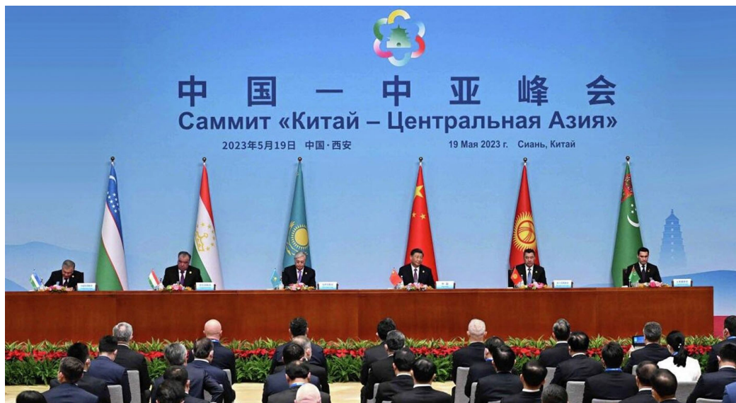
Рис. 3. Саммит «Китай — Центральная Азия», Сиань, май 2023