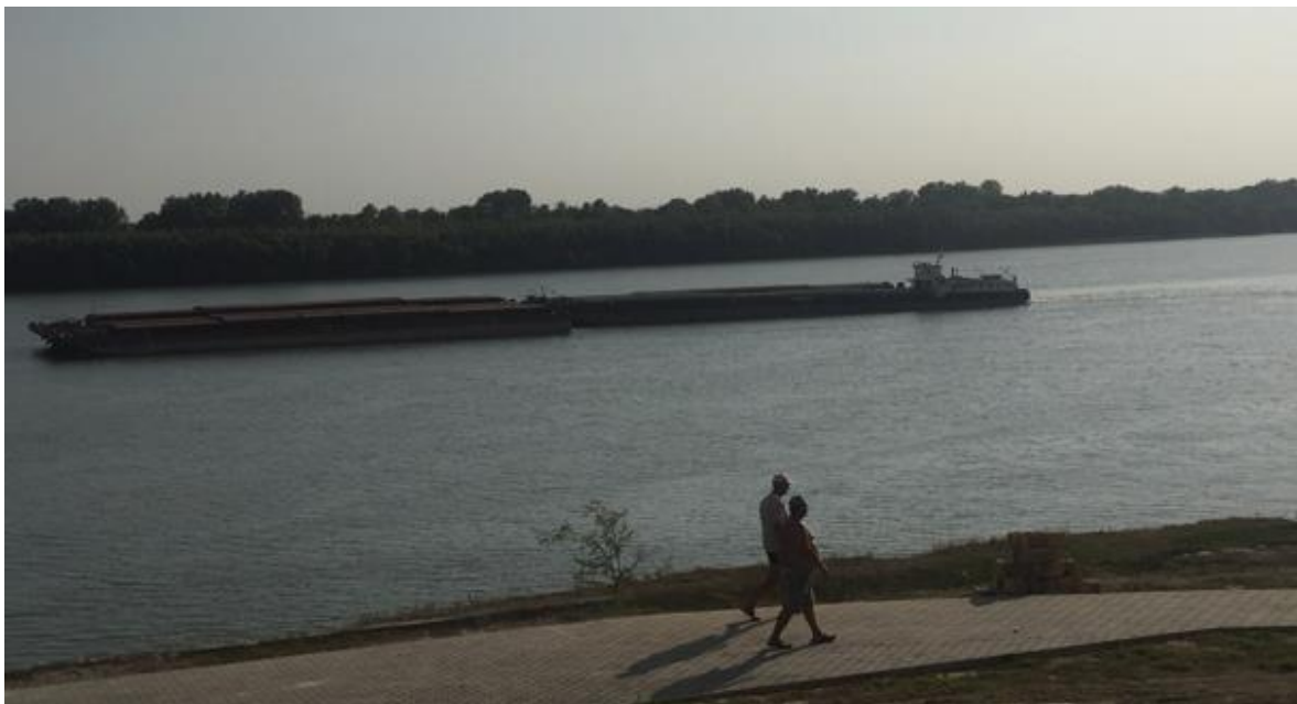
Танкер йде по Дунаю до Чорного моря поблизу старого міста Ізмаїла.

Ріка Дунай, ще одне потенційне джерело значної економічної вигоди, також використовується недостатньо. Річковий рух українською частиною дельти Дунаю за останні роки знизився, оскільки румунська сторона стала основним міжнародним водним шляхом. Місцевий бізнесмен у Вилковому, розташованому в дельті, підрахував, що нині обсяг річкових перевезень у його місті вдвічі менший, ніж був кілька років тому.