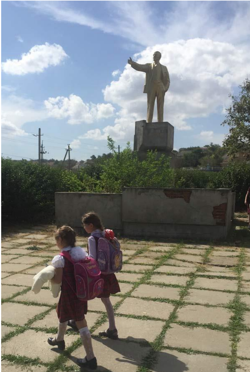
Підпис: Двоє дітей з гагаузької меншини Бессарабії на йдуть додому зі школи, проходячи повз статуї Володимира Леніна в селі Виноградівка біля міста Болград.

Мовні права та особливо статус російської мови були полем політичних битв в Україні з часу проголошення незалежності. Закон 2011 року, який надав російській мові статус регіональної, був непопулярний у Західній Україні. Новий закон скасовує це і надає українській мові пріоритет як державній мові всіх шкіл. Інші мови можна використовувати для навчання в початкових школах, але їх використання в середніх школах обмежується.